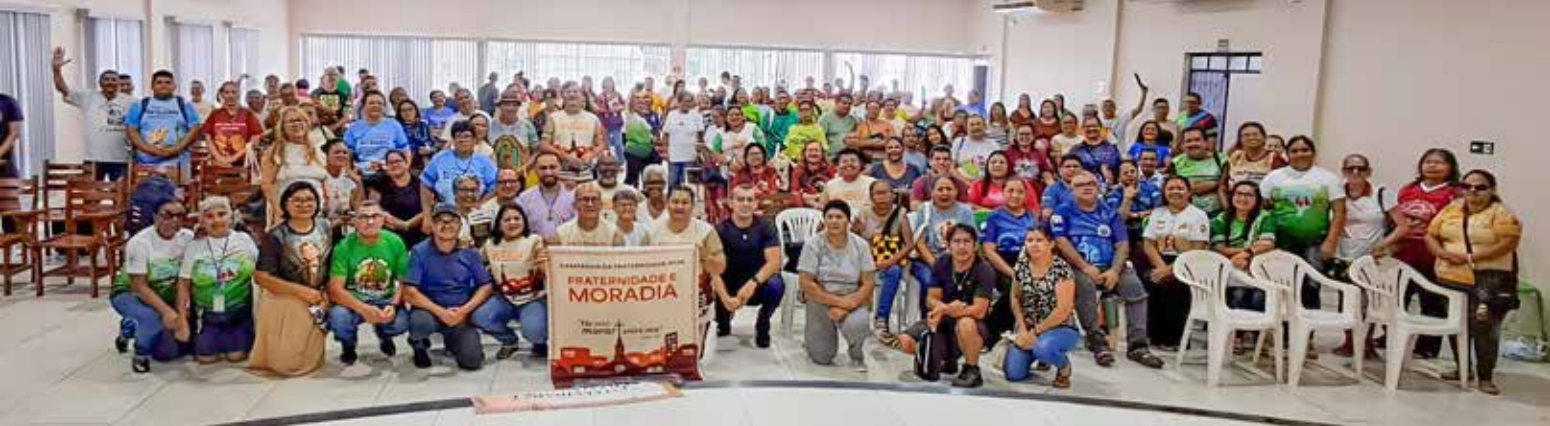
Participantes da Região N. Sra. dos Navegantes