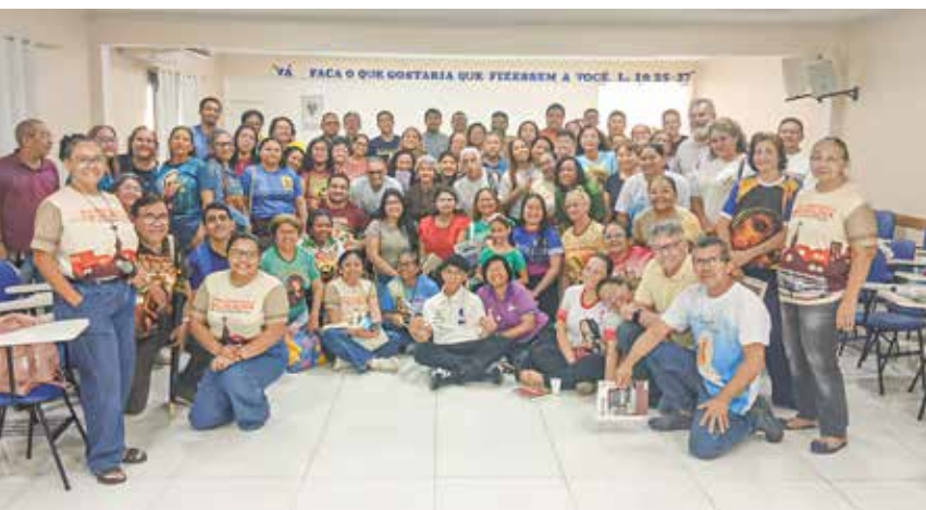
Participantes da Região N. Sra. dos Remédios