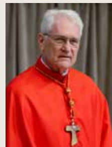
Cardeal Leonardo Ulrich Steiner Arcebispo de Manaus

Nossa Senhora da Conceição, que te invocamos como “Casa de ouro” por vos terdes deixado ser receptividade “ventricia”, rogai por nós!