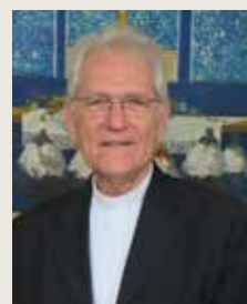
Cardeal Leonardo Ulrich Steiner Arcebispo de Manaus

Nossa Senhora da Conceição, rogai por nós!