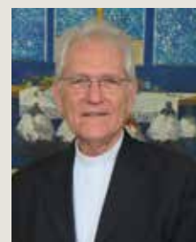
Cardeal Leonardo Steiner Arcebispo de Manaus

Maria, Mãe da Esperança, nos acompanhe no nosso peregrinar rumo ao Reino definitivo! Nossa Senhora da Conceição, rogai por nós!