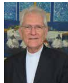
Cardeal Leonardo Steiner Arcebispo de Manaus

Maria, Mãe da Esperança, nos acompanhe no nosso peregrinar rumo ao Reino definitivo! Nossa Senhora da Conceição, rogai por nós!