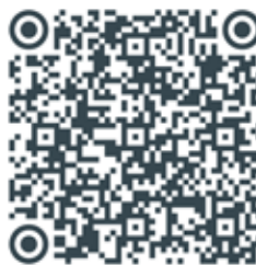
Acesso ao Diretório para estudo

Esse processo, desde já, tem envolvido a Igreja de Manaus como um todo, com o objetivo de revisar o Diretório Pastoral, mas ao mesmo tempo, tem incentivado a sinodalidade nos diversos segmentos e instâncias. O mesmo Espírito que vem conduzindo a Igreja de Manaus na sua história tem fortalecido nossa Arquidiocese, promovendo ainda mais um caminhar sinodal. Que a partir desse processo de revisão do Diretório vivamos ainda mais ainda em comunhão, participação e missão, nesse coração da Querida Amazônia.