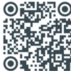
Link para envio das contribuições